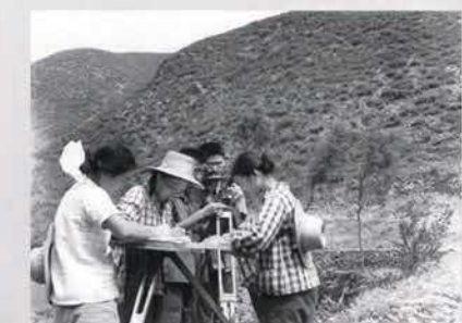
大一测绘野外实习（右一为笔者）

我庆幸，当年我报考了师大，报考了地理系，我成了新中国重要历史转折期的天之骄子。师大地理系也是我人生中重要的转折点，在师大，我获得了今生第一张文凭。