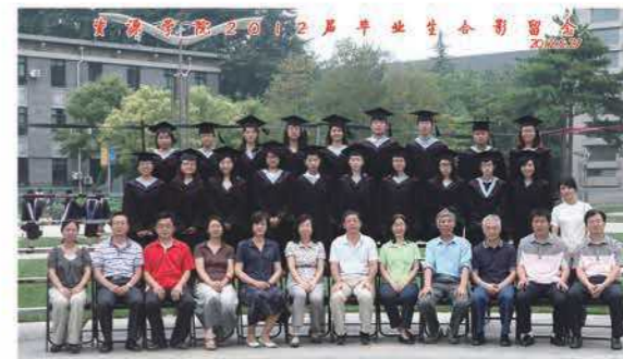
资源学院2008级校友毕业留念