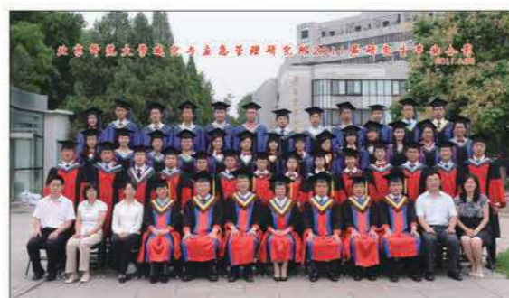
减灾与应急管理研究所2008级校友毕业留念