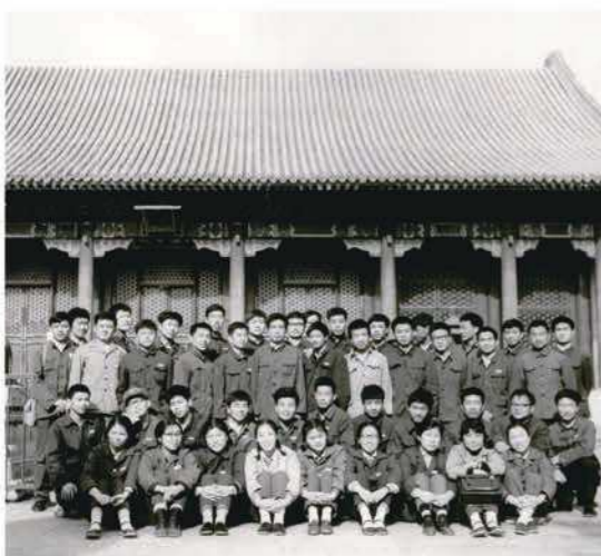
78级1979年5月颐和园春游

2018年10月6日，北京师范大学为77、78级校友举行入学40周年纪念大会活动，校长董奇、副校长周作宇出席大会，大会由校友总会副会长陈光巨主持。纪念大会特别设置了师长代表为身穿学位服的77、78级校友拨穗环节，以纪念77、78级校友在母校学有所成，表达学子对母校和恩师滋兰树蕙、桃李满园的祝愿。