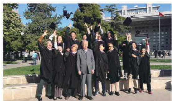
2018年赵先生与77、78级校友合影