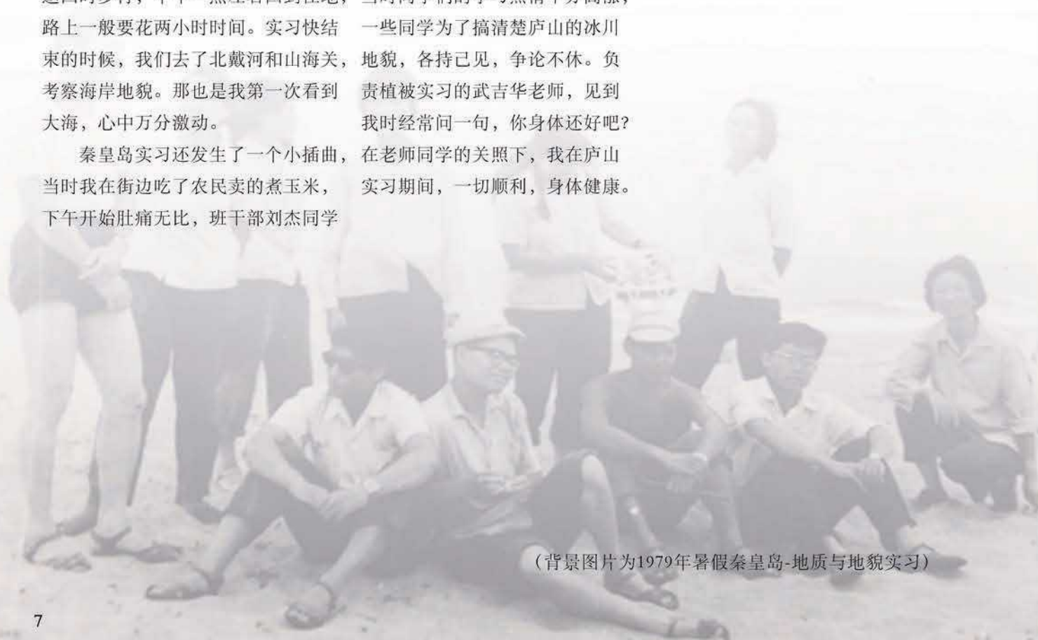
(背景图片为1979年暑假秦皇岛-地质与地貌实习)

北师大地理系77级，我为成为你的一员而骄傲，同时感谢各位老师 and 同学们，为我留下了人生最美好的记忆。