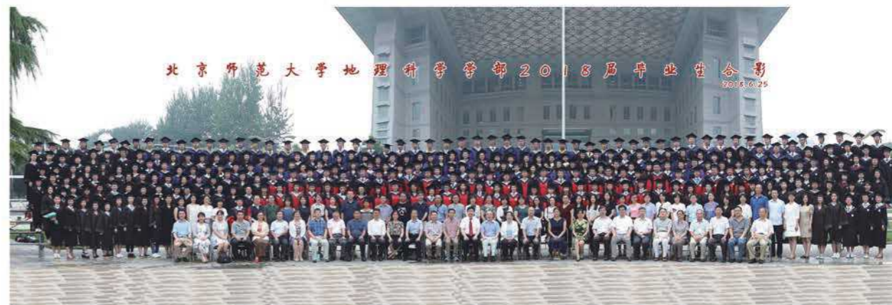
地理科学学部2018届毕业生合影