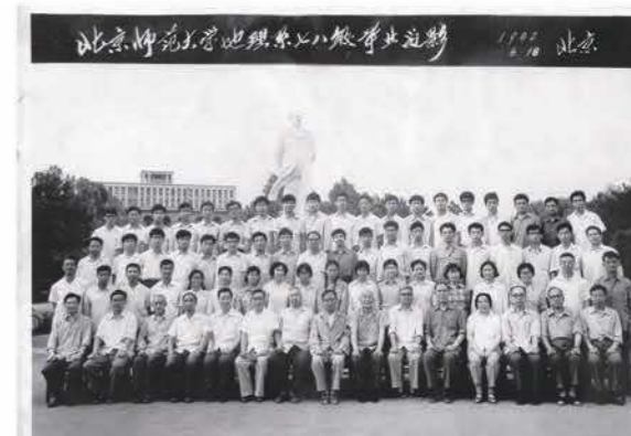
地理系1978级校友毕业留念