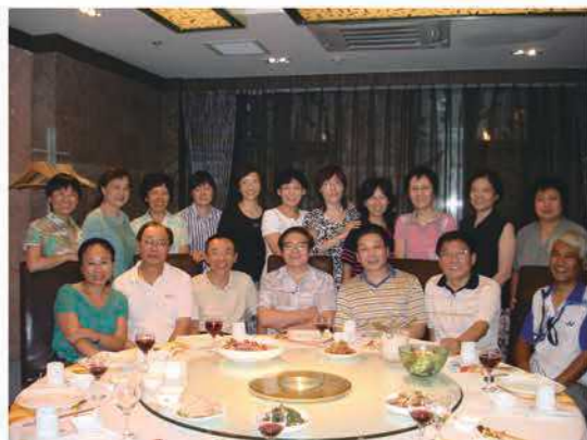
77级2012年聚会-校庆110年聚会

改革开放的第四十年，也是77、78级大学生入学的四十周年纪念。1977年10月21日，《人民日报》刊登的一则“恢复高考”的消息，顿时激活了数百万知识青年沉寂的心田，唤醒了许多人尘封已久的“大学梦”，点燃了无数人通过高考改变命运的希望之火。冰封10年之久的高考大门被打开，一时间，工人、农民、上山下乡和回城的知识青年们，无不欢欣鼓舞，他们为了各自的梦想走进考场。77年高考570万人报名，录取27万人；78级考生610万人，仅录取40.2万人，所以77、78级是国家栋梁、是改革开放的弄潮儿，他们毕业后又在各自岗位上奋斗拼搏取得了卓越的成绩，更是改革开放成绩的贡献者（摘自顾明远先生在纪念大会上的讲话）。我们77、78级校友为国家做出贡献，为母校赢得荣誉，是北师大的骄傲，是北师大在校师生的榜样。