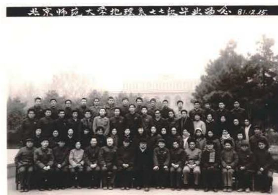
地理系1977级校友毕业留念