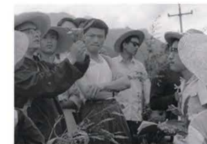
植物地理野外实习

学在图书馆晚上十点闭馆后，还会到教室继续学习，那时教室的灯会亮到深夜。我们把这种学习精神叫做“死磕”。也许我们经历过中断学业的饥渴，“珍惜”“认真”“执着”是我们77级学生身上学习的“标签”，能在这样的集体中生活、学习，是我的幸运。