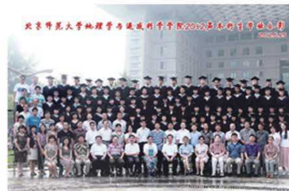
地遥学院2008级校友毕业留念