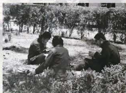
同学们在美丽的校园里读书

那时在课堂、图书馆、校园和野外实习基地，同学们都如饥似渴的学习，向老师学，向书本学，向实践学。