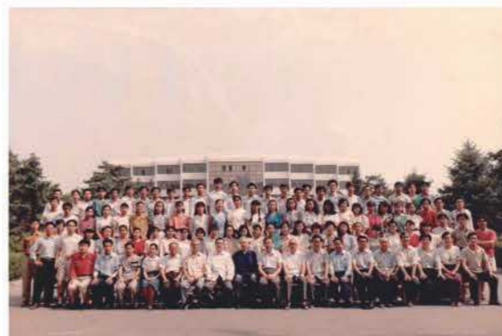
地理系1988级校友毕业留念