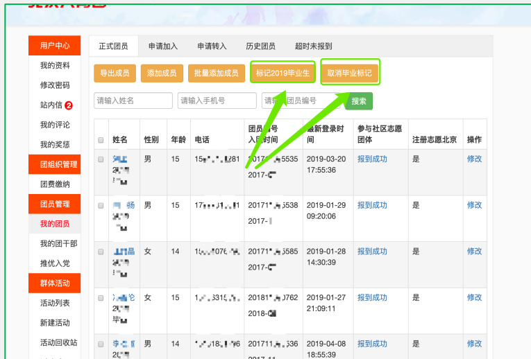
(2) “毕业年份不统一”团支部的额外操作